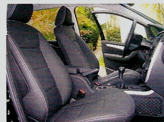
Mercedes Classe B, cuir noir, surpiqûre gris alpaga avec pose de motif à chaud à la feuille d'or blanc.

Choisissez votre teinte de cuir et votre couleur de fil, ou créez-les vous-même, ajoutez-y votre touche personnelle et le sellier automobile Carium réalise pour vous sur mesure votre intérieur de rêve. Délai : de 1 à 5 semaines. Carium Design, 168 bis rue de la Roquette, 75011 Paris. Tél. : 01 44 64 97 16 www.carium-design.com