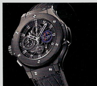
Aero Bang Drive ACF, chronographe en série limitée, 250 exemplaires, céramique sur bracelet croco, 13 400 €.

Le plus ancien automobile club du monde s'associe à la marque horlogère Hublot avec la création d'une montre à ses couleurs dont une partie des royalties sera reversée à la fondation ICM (Institut du Cerveau et la Moëlle épinière), dont le fondateur n'est autre que Jean Todt, le nouveau président de la FIA.